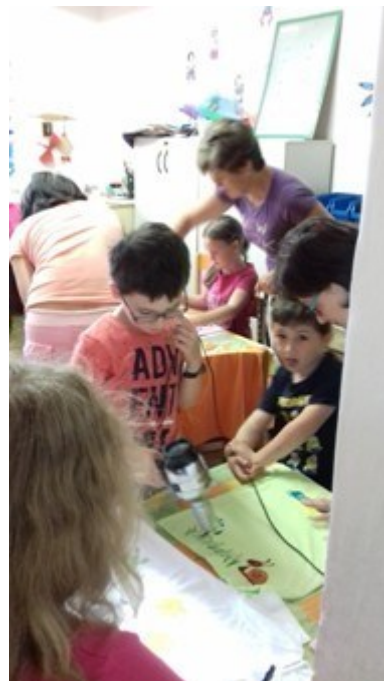
Kroužek Dovedných rukou a Šikulů