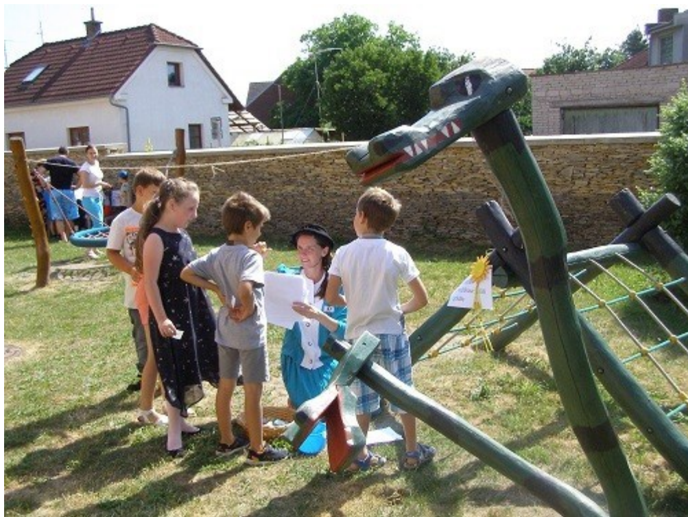
Pasování na čtenáře