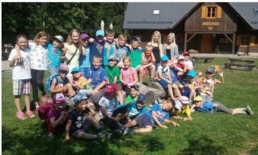
Jazykový příměstský tábor