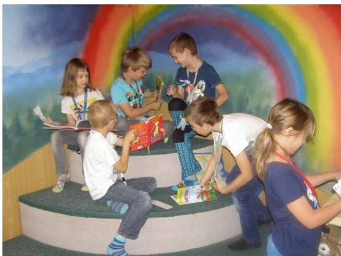
Návštěva 1. A v knihovně