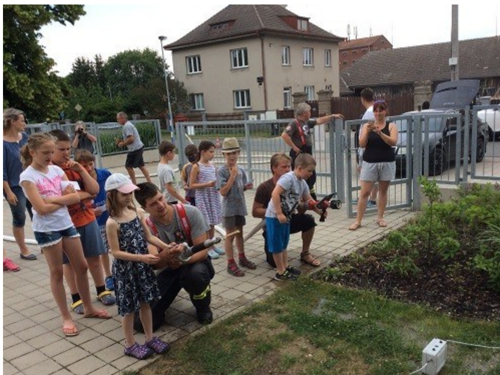
Dobrovolní hasiči a Den dětí