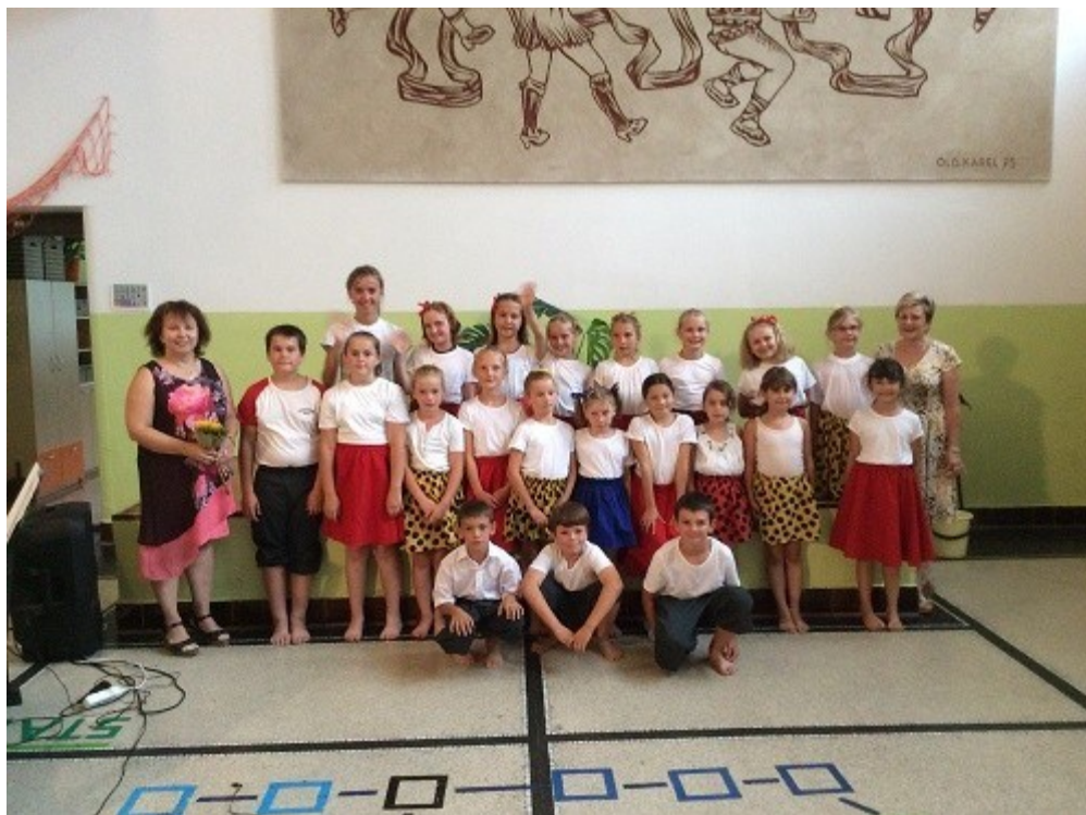
Závěrečné vystoupení pěveckého sboru