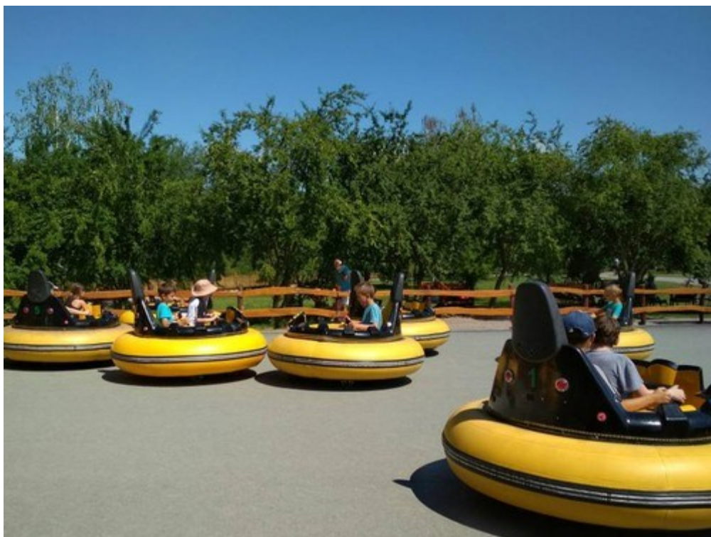
Školní výlet do Fajnparku v Chlumci nad Cidlinou