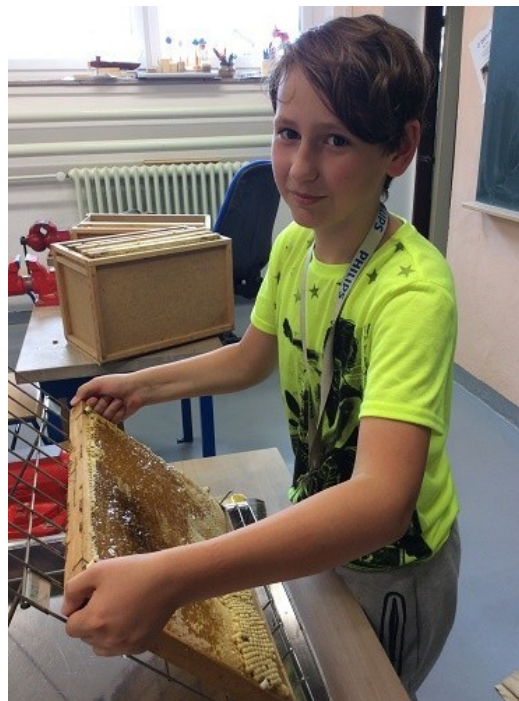
První vytáčení medu Včelařského kroužku