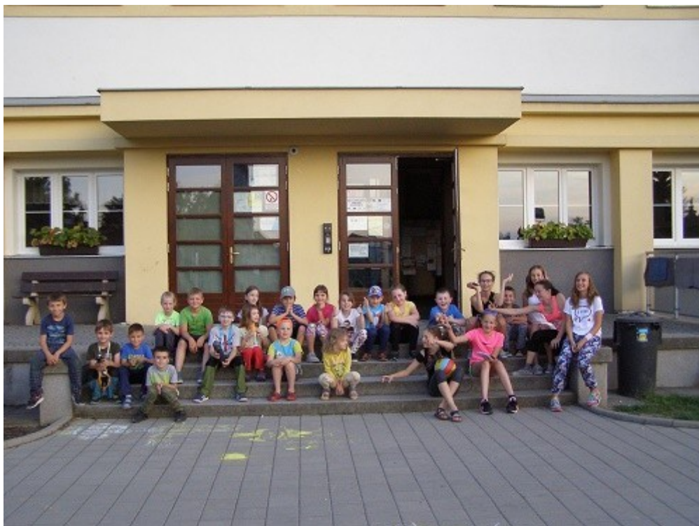
Společná noc ve škole