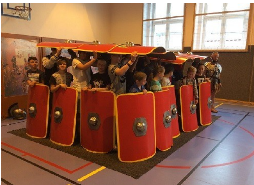
Středověk v podání Pernštejnů