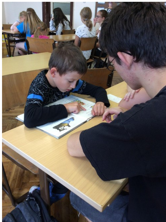
Prvníci čtou devátákům