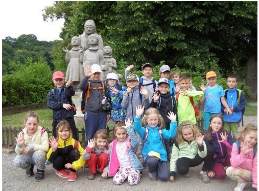
Výlet do Ratibořic