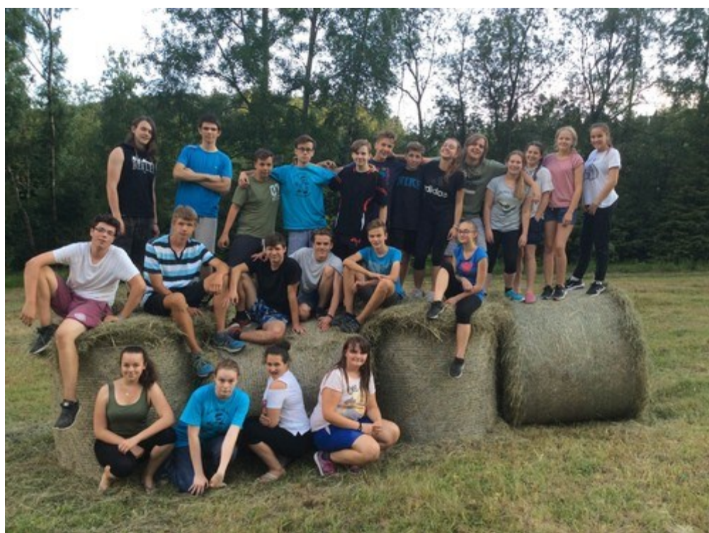
Rozlučkový výlet absolventů – sokolská chata